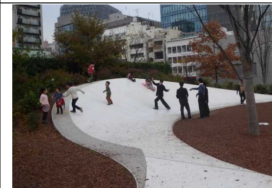
・子供たちの遊び場