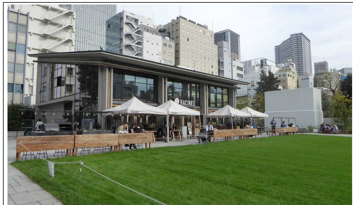
・レストランと芝生のある公園

また、緑地はグリーントレンチの敷設や落葉マルチなどにより、雨水の貯留・浸透に配慮する。