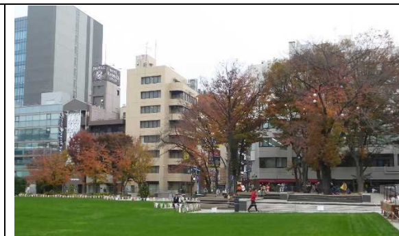
・四季を感じる植栽