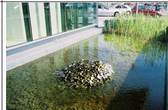
・レイン・ビオトープイメージ